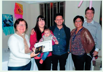
Entrega das Bíblias