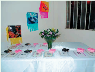
Bíblias e pastas