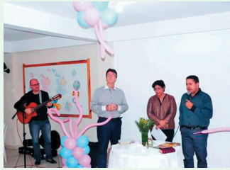
Momento de Oração e Louvor