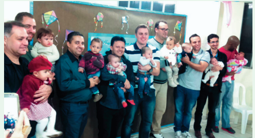
Pais e bebês