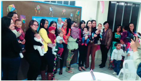
Mães e bebês