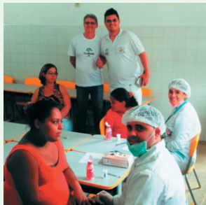
Dentistas (Aplicação de Fluor)