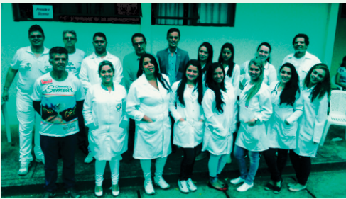
Profissionais / Voluntários