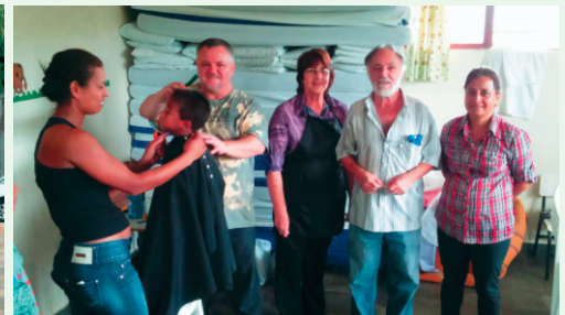
Equipe: Corte Cabelo