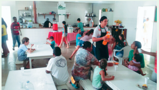
Cozinha / Refeitório