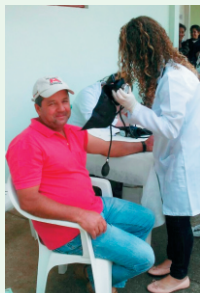
Aferição de Pressão