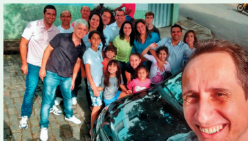
Equipe B. S. Vicente