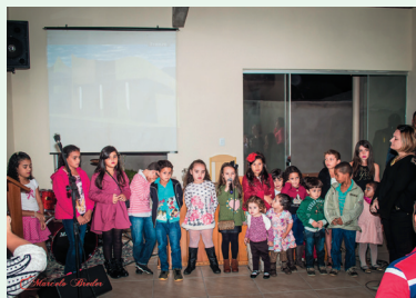
Participação das crianças