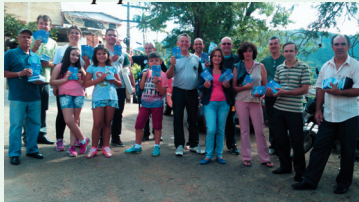
Equipe B. N.S. Aparecida