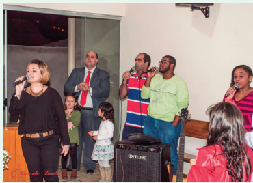
Equipe de louvor