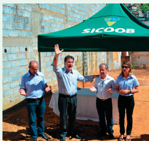
Momento da Bênção