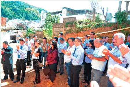
Parte do público presente