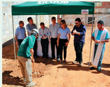
Colocação da Pedra Fundamental