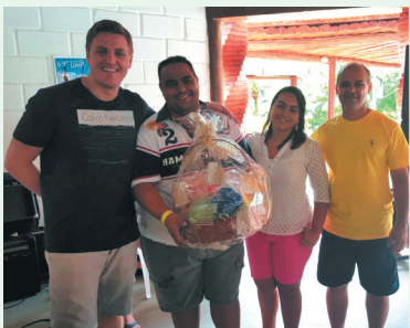
Homenagem/Gratidão - Banda AME