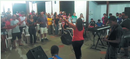
Momento de Louvor (Banda AME)