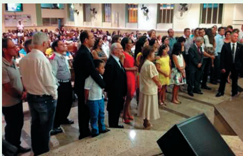
Posse Diretorias e Nomeados