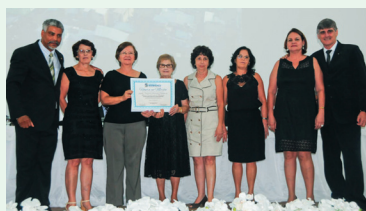
Homenagem SAF Centenária