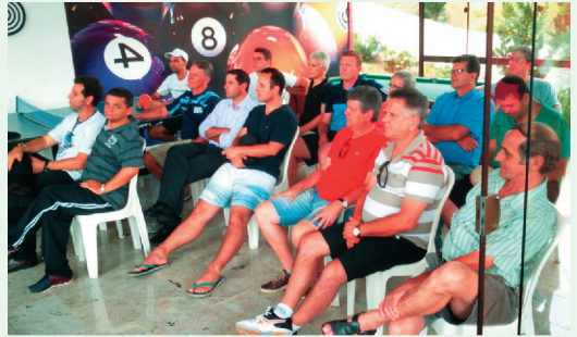
Participantes (Presbíteros, diáconos e pastores)