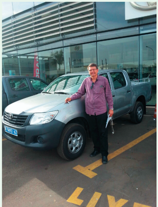
Miss. Gérson e o novo veículo