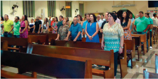
Alguns casais participantes do Encontro