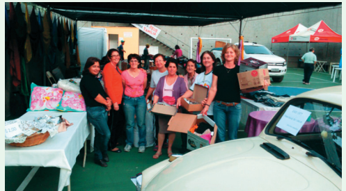
Organização dos produtos