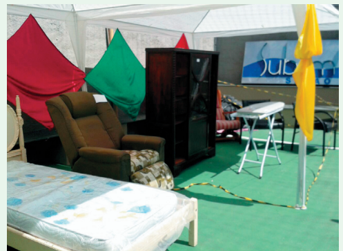
Doações: Móveis e etc.