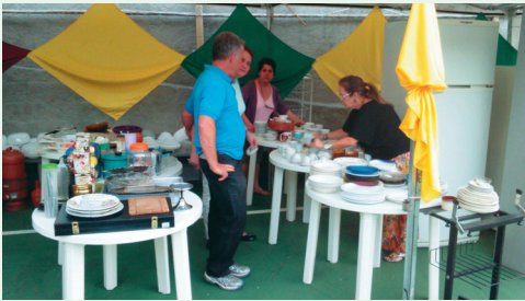
Organização dos produtos