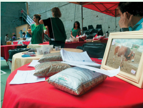
Doações: Café e boi