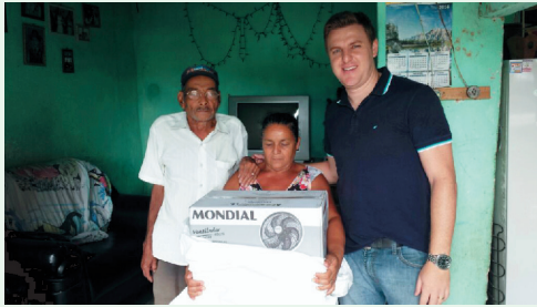
Milton Jr. entregando a doação