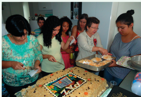
Hora do Lanche! Torta deliciosa.