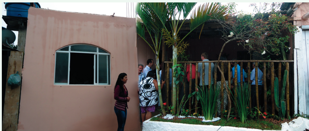
Fachada da Casa