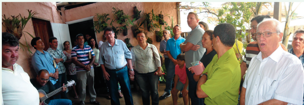
Alguns Participantes do Culto de Gratidão no dia 14/12/2014