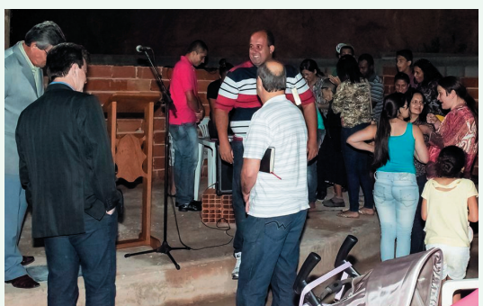
Culto - Lançamento da Pedra Fundamental