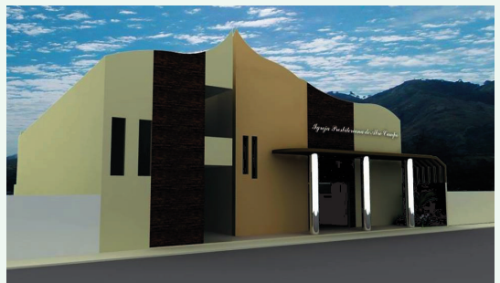
Maquete do futuro Templo Presbiteriano