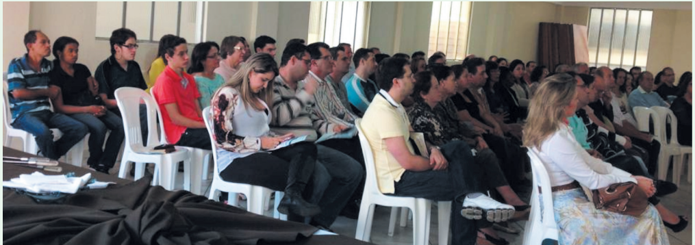
Alunos e Alunas participantes