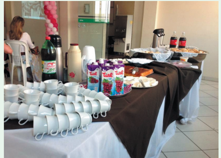
Cafê da Manhã