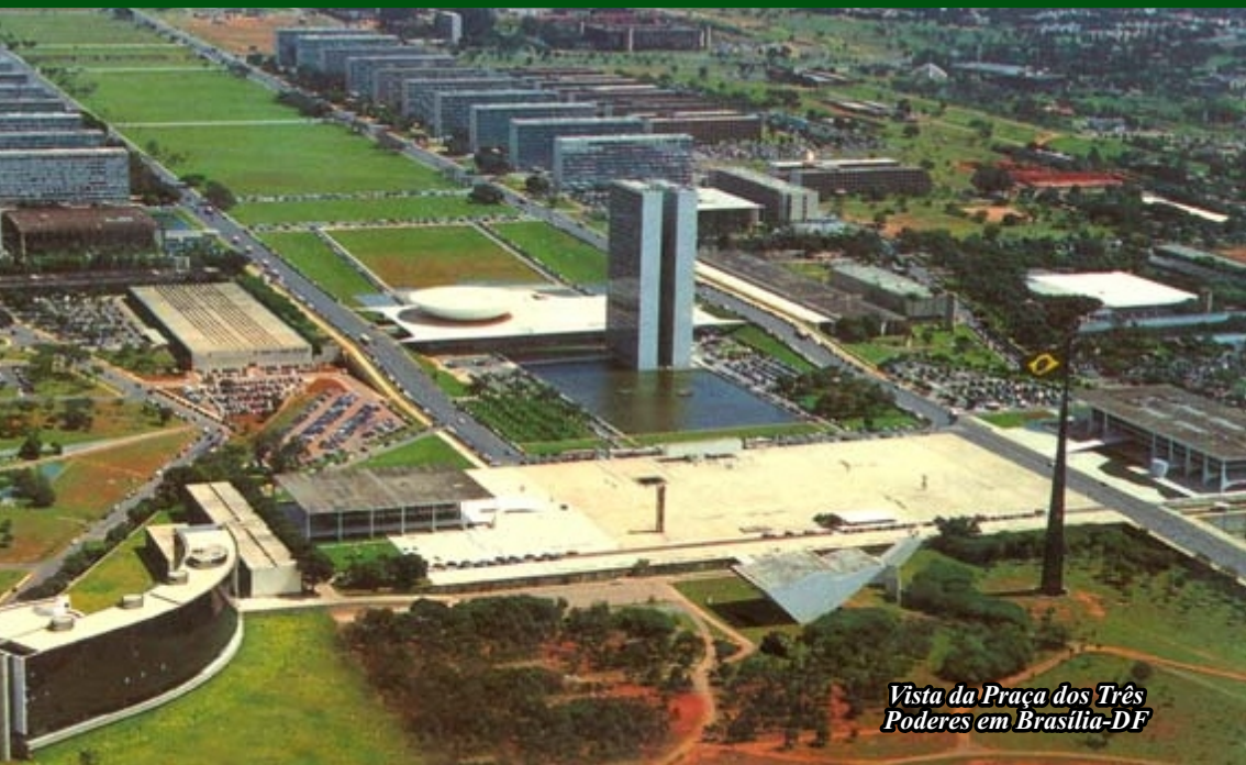
Vista da Praça dos Três Poderes em Brasília-DF

Boletim Dominical - Nº 803 - Ano XIV - 29/06/2014 Acesse: www.ipmanhuacu.com.br