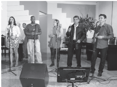
Ministério de Louvor IPM - Vocal