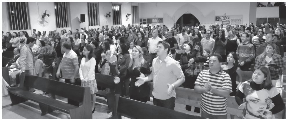
Povo de Deus em Adoração