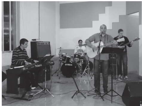
Ministério de Louvor IPM - Instrumental