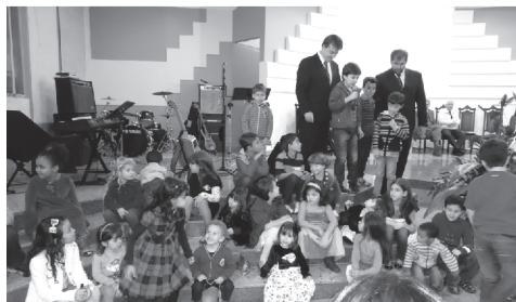
Oração pelas crianças