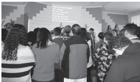
Pessoas indo à frente - apelo para vida de Oração