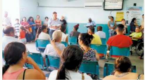
Evangelismo na UPA (Unidade de Pronto Atendimento) dia 14/09/19 - Sábado