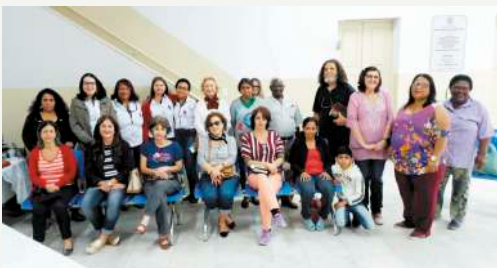
Evangelização na Prefeitura dia 03/06