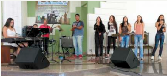
Louvor: Sócios e sócias da UPA