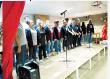
Ex Polivalente (sexta a noite)