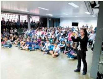
Ex Polivalente (sexta a tarde)

Foi uma grande bênção receber o Grupo EMME da Palavra da Vida, nesses dois dias. Uma equipe de cerca de 30 pessoas, realizou trabalhos magníficos aqui no templo (16/05) e nas Escolas Estaduais (17/05) Cordovil P. Coelho e Ex-Polivalente. Foram realizadas 06 apresentações com grande proveito espiritual. Nas escolas cerca de 1.500 alunos (as) participaram e foram impactados (as) pelas mensagens. Deus seja louvado. Oremos para que a semente que foi tão bem semeada possa frutificar.