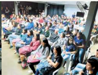
Ex Polivalente (sexta a noite)