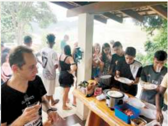
Orient. Emanuel e Participantes