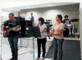
Grupo Louvor - C.S.J. do Mçu