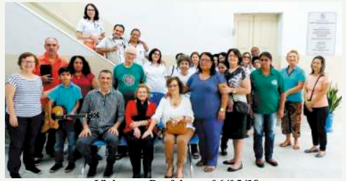
Visita na Prefeitura 06/05/19