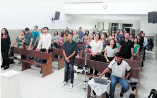
Participantes Culto 05/05