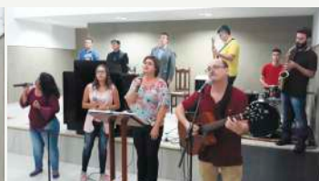
Grupo Louvor - IPM Sede