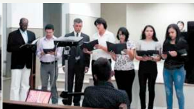
Grupo de Adoração - C. S.J. do Mçu