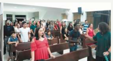
Participantes do Culto 04/05