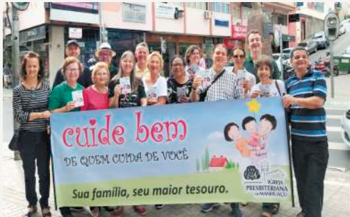
Alguns colaboradores na distribuição do Cada Dia

No sábado (04/05) de 08h às 10h um grupo de irmãos e irmãs realizou uma ampla distribuição de cerca de 04 mil exemplares do CADA DIA FAMÍLIA no sinal do centro da cidade e comércio. Oremos para que esta semente germine nos corações. Damos graças a Deus pelas pessoas que colaboram neste grande trabalho de evangelização.