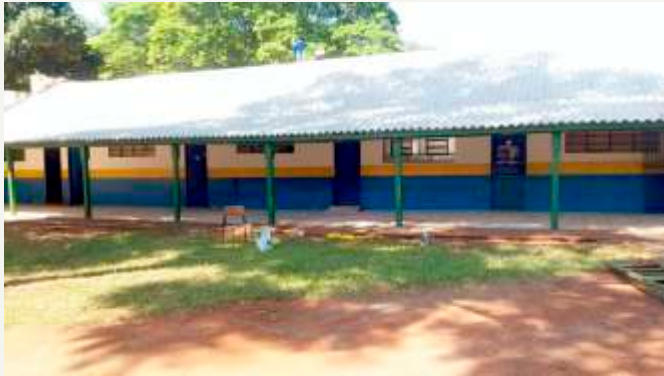
Escola Indígena com o novo telhado