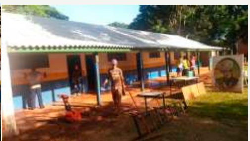
Algumas pessoas em trabalho