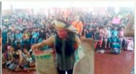
Homenagem da Escola para a Caravana