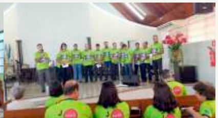
Culto I. P. Dourados