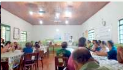
Momento Devocional com Café da manhã