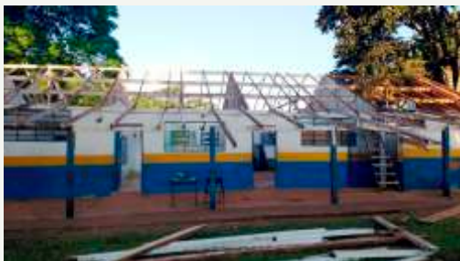
Troca de telhado da Escola Indígena