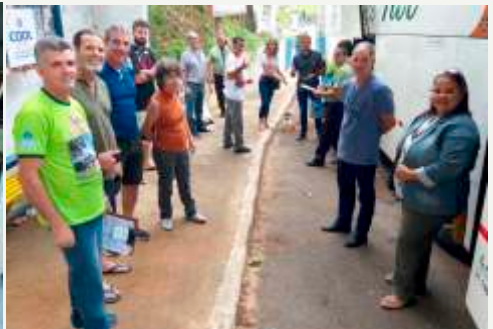
Saída para a Missão Caiuá