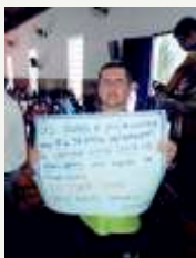
Cartaz de agradecimento a Caravana