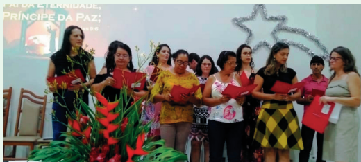
Coral de Adultos