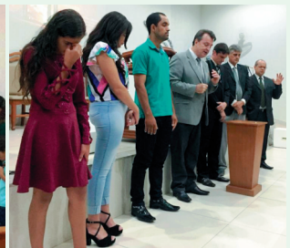
Profissões de Fé e Batismos