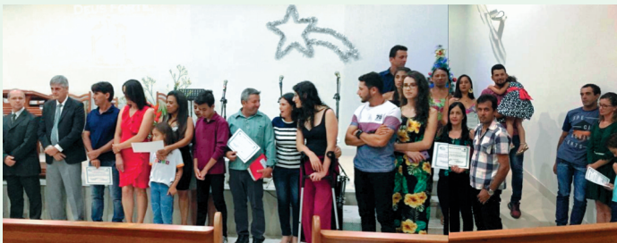
Entrega Certificados Grupo de Oração Habacuque