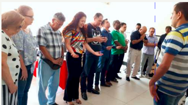
Oração de Gratidão pelas entidades e Conselhos Municipais