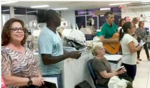
Culto Renalclin - 04/12