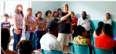
Culto na Unidade de Pronto Atendimento (UPA) - 08/12