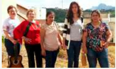
Visita à Renalclin - 22/10