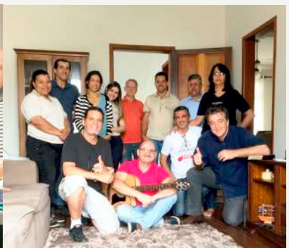
Casa Rev. Renato - 25/09