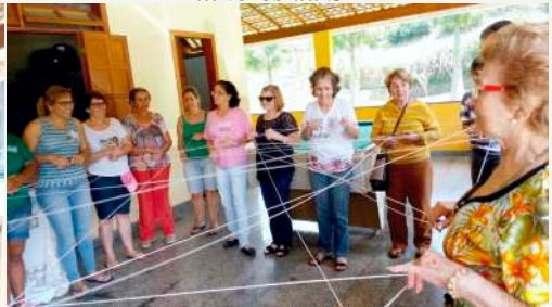
Dinâmica do barbante