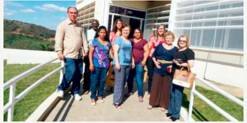
Visita à Renalclin - 25/09/18

Amanhã, (01/10/18) nos reuniremos na Prefeitura às 8h da manhã com a participação especial do Departamento Lídia.