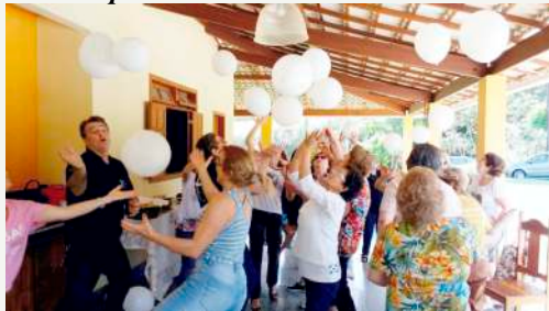
Dinâmica dos balões