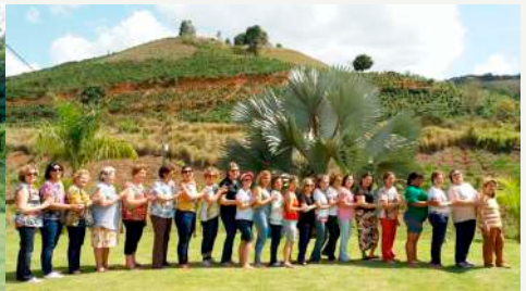
Mulheres da SAF