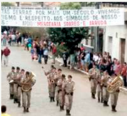
Banda música 11º BPM