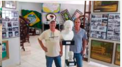
Museu do Colégio - APCE