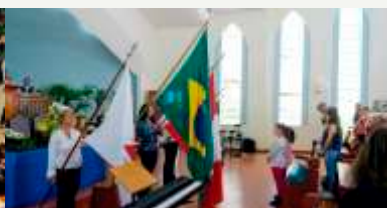
Entradas das bandeiras - Culto