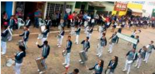
Desfile Cívico - Fanfara