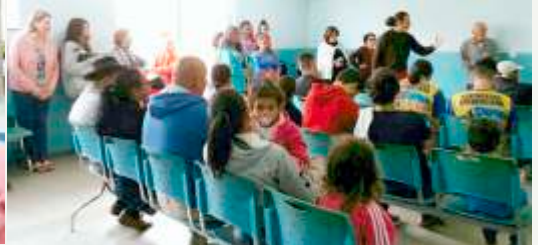
Momento Ministração da Palavra na UPA