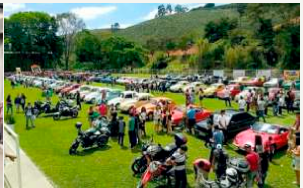
Exposição carros antigos