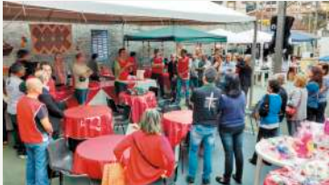
Preparação para abrir bazar

O resultado financeiro superou o do ano passado, o qual será anunciado no próximo domingo, acompanhado do resultado dos Cofrinhos Missionários. Esse Super Bazar é 100% dedicado à obra missionária. Muitos missionários serão abençoados com esses recursos. Deus seja louvado. Aos que trabalharam, doaram e compraram a nossa profunda gratidão.