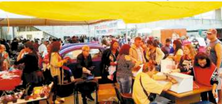
Caixas e vista geral