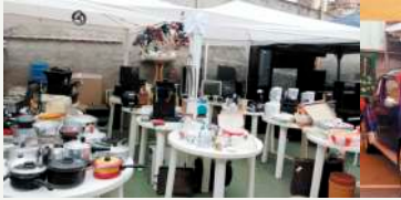
Doações - Materiais diversos