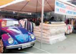
Doação (Fusca Missionário)