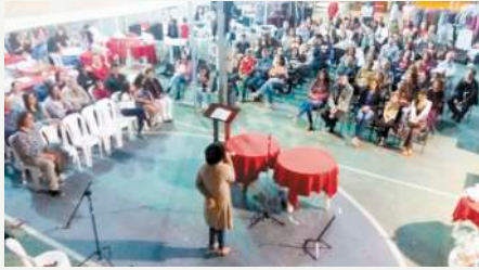
Vista geral do bazar - Culto Missionário - Noite

Nos dias 23, 24 e 25 de agosto/18 aconteceu a quarta edição do Super Bazar Missionário da Igreja Presbiteriana, o qual foi precedido por várias semanas de intensa preparação. Foram dias extremamente abençoados pelo Senhor, com uma participação/apoio de um expressivo número de colaboradores da IPM. As doações nos surpreenderam, bem como a Praça de Alimentação Missionária. Houve um clima de trabalho duro e participativo, feito com muita alegria e união. Deus nos deu um clima muito bom, a Ele nossa gratidão sincera.