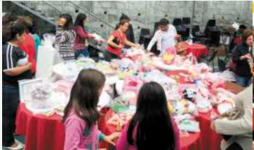
Doações - brinquedos