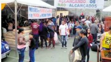
Vista geral do bazar