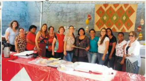
Algumas mulheres da SAF na Praça de Alimentação