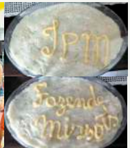
Escondidinho de mandioca