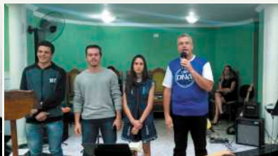
Representantes da Nacional e da Sinodal de UPAs