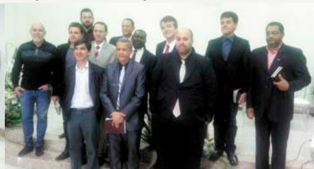
Pastores e Líderes da JMP/PRVM