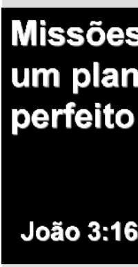
Martyn Lloyd Jones

Dois coisas vão acontecer: Ou os pecadores se converterão ou se converterem.