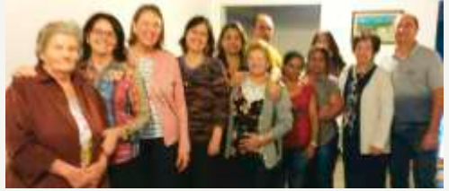
Casa Rita Isabel - 18/06/18

Amanhã, dia 25 de junho, segunda-feira, estaremos visitando a Renalclin, às 14 horas. Encontrar na porta da IPM. Contamos com a participação de todos os componentes!