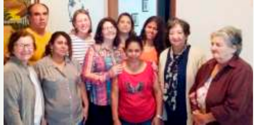
Casa Dona Nini - 18/06/18