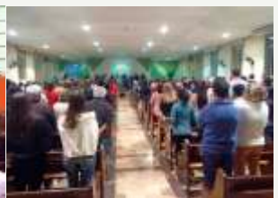
Igreja em adoração