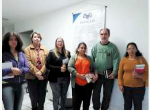
Culto na Renatclin - 28/06/2018

Amanhã, dia 04 de junho, segunda-feira, haverá culto na Prefeitura, às 08h, participação do Departamento Raquel. Conta-se com a presença de todos!