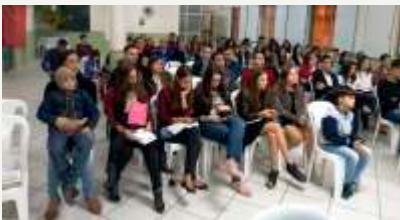
Participantes Culto Sábado (26/05/18)