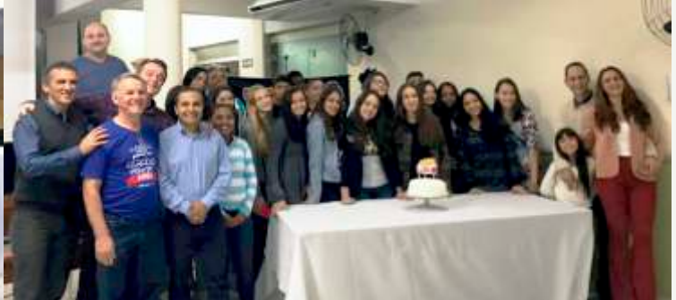
Pastores, Adolescentes e Orientadores