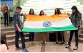
Bandeira Índia - Oração