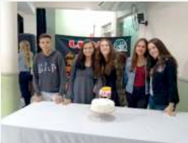
Diretoria UPA 2018