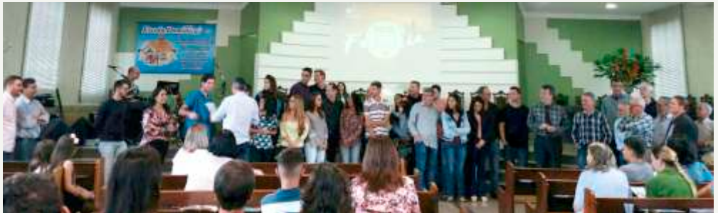
UPH ora pelos jovens e revela PAIS DE ORAÇÃO

O DJP (Dia do Jovem Presbiteriano) deste ano foi comemorado com muito entusiasmo, alegria e comunhão no Senhor. Sob a temática anual - “Quero ser atraído pelo teu amor”, baseada em (Jr 31.3), realizamos nosso encontro de jovens no Sábado 19/05 às 19h30min na 1ª Igreja Presbiteriana de Manhauçu. Contamos com o apoio das diretorias da nossa Federação e da Sinodal. Contamos