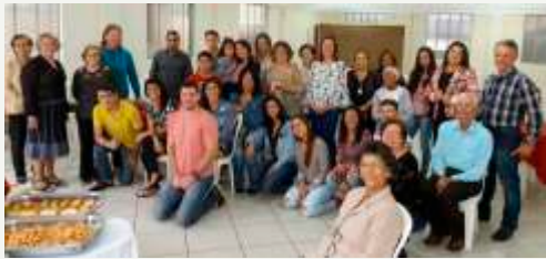
Café manhã - Oferecimento SAF

“Lembra-te do teu CRIADOR nos dias da tua mocidade...”