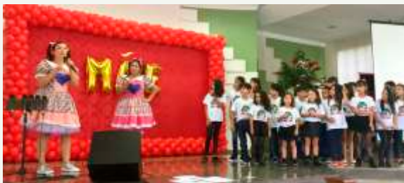
Apresentação UCP/Dep. Infantil