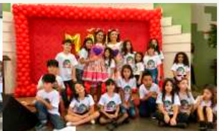
Crianças com as "bonecas"