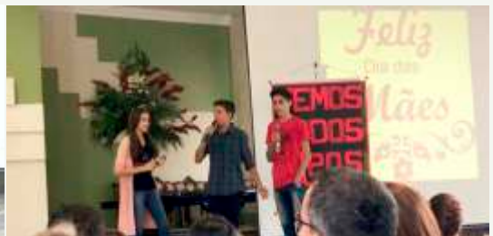
Apresentação Adolescentes (UPA)