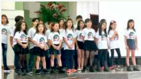
Crianças da UCP/Dep. Infantil