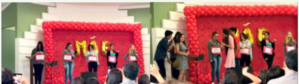
Apresentação Adolescentes (UPA)