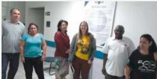
Culto na Renalclin - 30/04/18

Amanhã, dia 07 de maio, segunda-feira, haverá culto na Prefeitura às 08h. Conta-se com a presença de todos!