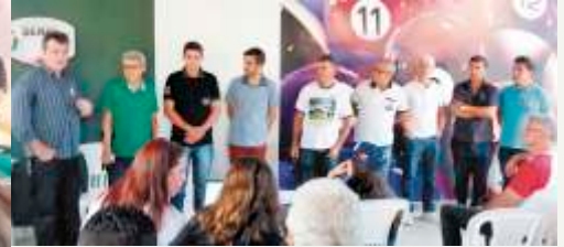
Diretoria Confederação UPHs