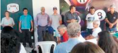
Voluntários: Timon, Missão Caiuá e Luisburgo