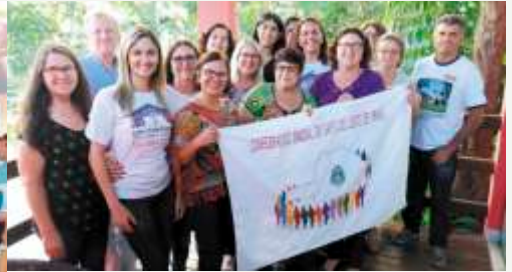
Diretoria Confederação SAFs e visitantes