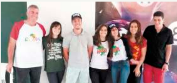
Diretoria Confederação UPAs