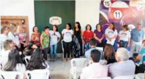
Diretoria Confederação SAFs