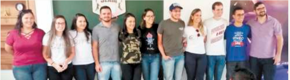
Diretoria Confederação UMPs