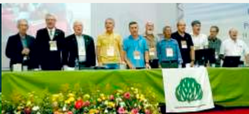
Nova Diretoria eleita