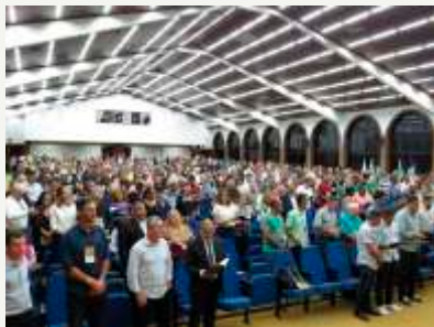
Audatório / Participantes