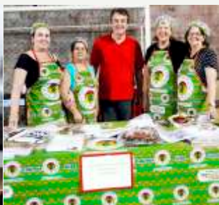
Decoração: Pano da I.P.Angola