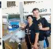
Entrega da oferta - Asas de Socorro - Anápolis - GO