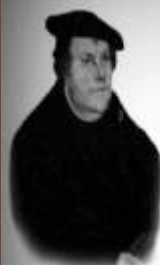
Martinho Lutero (1483-1546)

"O verdadeiro tesouro da Igreja é o santíssimo Evangelho da Glória e da Graça de Deus"