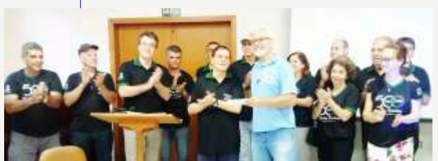
Entrega da oferta - Missão Novas Tribos