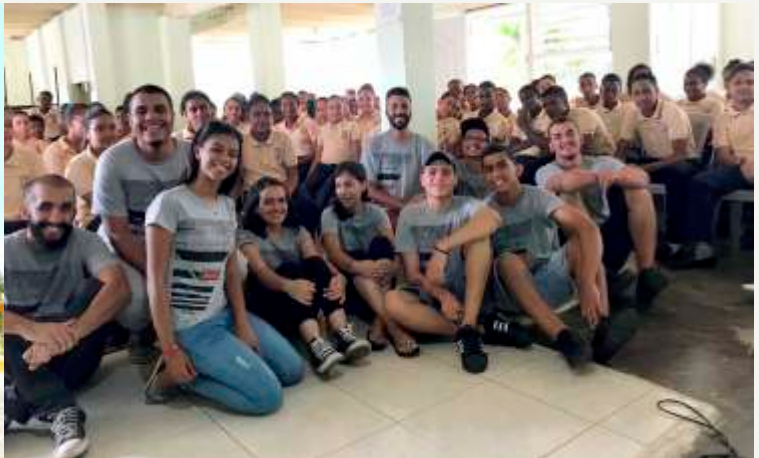
Equipe evangelizando na escola