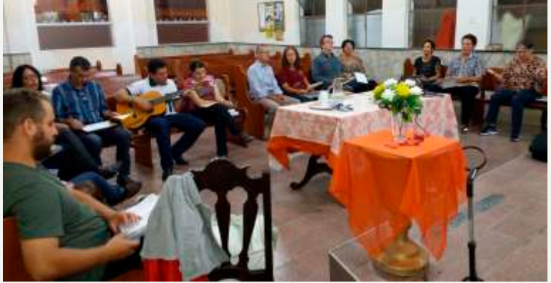
Participantes: Equipe Pastoral