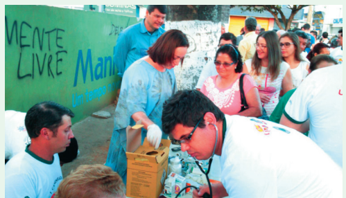
Comissão de Saúde