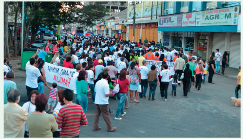
Saída da Caminhada