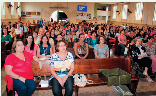
Mulheres participantes da reunião