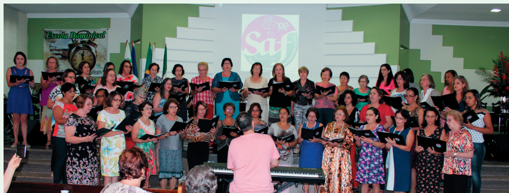
Coral do Centenário