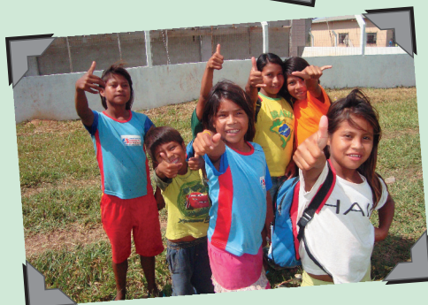
Fotos da Missão Caiuá na Aldeia de Taqwapery