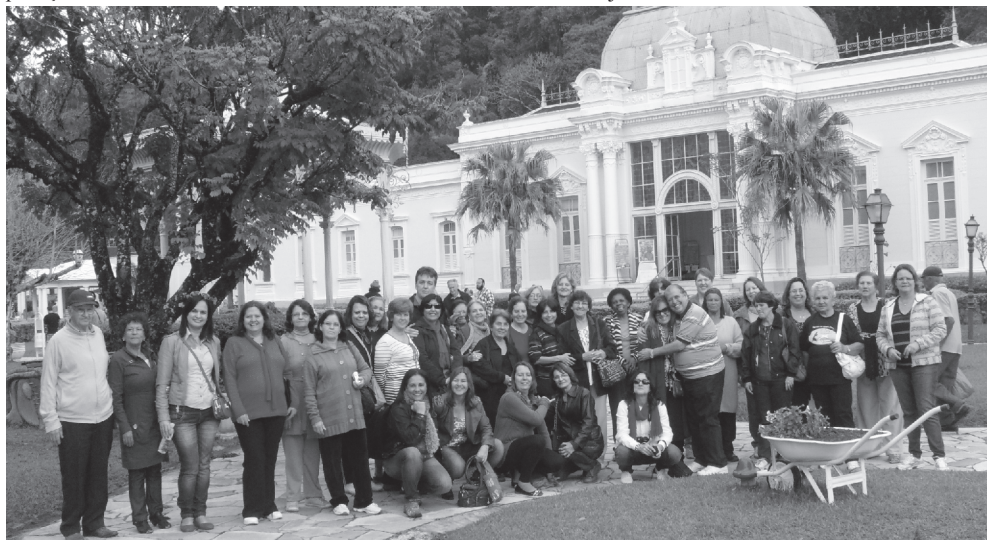
Participantes da Viagem Turística

No sábado, dia 20 de julho/13, um grupo de cerca de 40 pessoas, realizou agradável e proveitosa viagem às cidades mineiras de Caxambu e São Lourenço. Foram momentos de grande alegria, comunhão e compartilhamento. Em Caxambu o passeio começou com a visita ao Parque das Águas, onde várias fontes de águas foram visitadas. As águas são catalogadas e seu valor medicinal é mencionado para atender algumas áreas do corpo humano. Muitos passearam no teleférico e nas charretes da cidade. Um gostoso almoço foi servido no restaurante do Museu da História do Brasil. Este Museu foi visitado e muitas foram as recordações sobre o descobrimento de nossa Pátria. Em São Lourenço todos passearam pelas ruas centrais e fizeram algumas compras. Graças a Deus nenhuma nota desagradável foi verificada. A proteção divina foi uma realidade na ida e na volta. Parabéns SAF. Deus seja louvado.