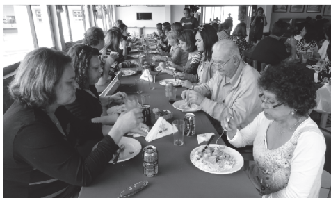
Almoço no Restaurante do Museu