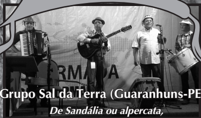
Grupo Sal da Terra (Garanhuns-PE) De Sandália ou alpercata, pregando o evangelho no Sertão.