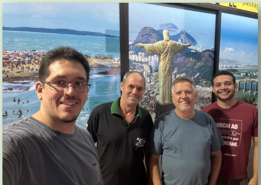
Encontro da Família Sinodal -SLM Sábado - 08/02/2025

Realização: Sinodal de Homens do SLM Reserve esta data e marque presença!