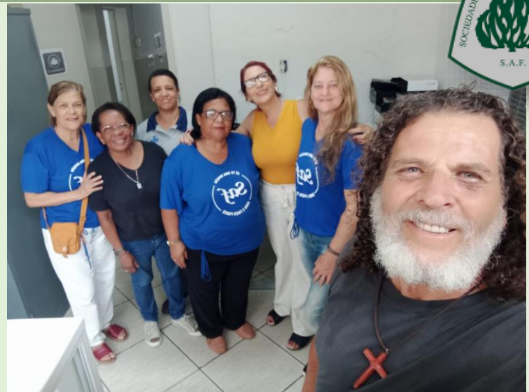
CEF – Cuidando e Evangelizando na Fila (20/12/24) - Distribuimos 180 folhetos e 3 Bíblias