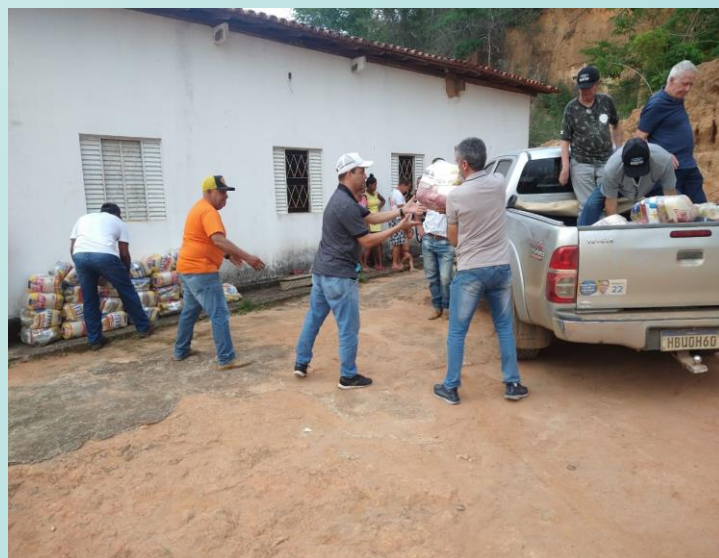
Entrega Donativos – Congr. Laranjeiras/Almenara