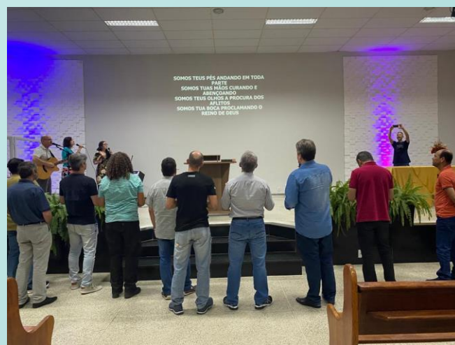
Liderança I.P. Almenara