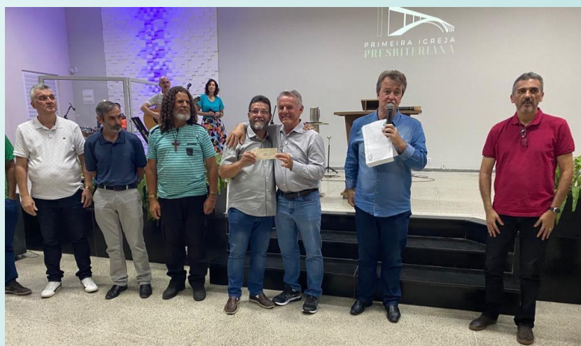
Entrega Oferta I.P. Almenara