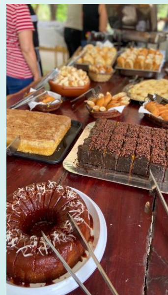
Café da Manhã na PV