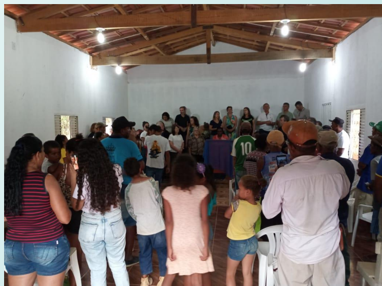
Culto - Congregação Laranjeiras / Almenara