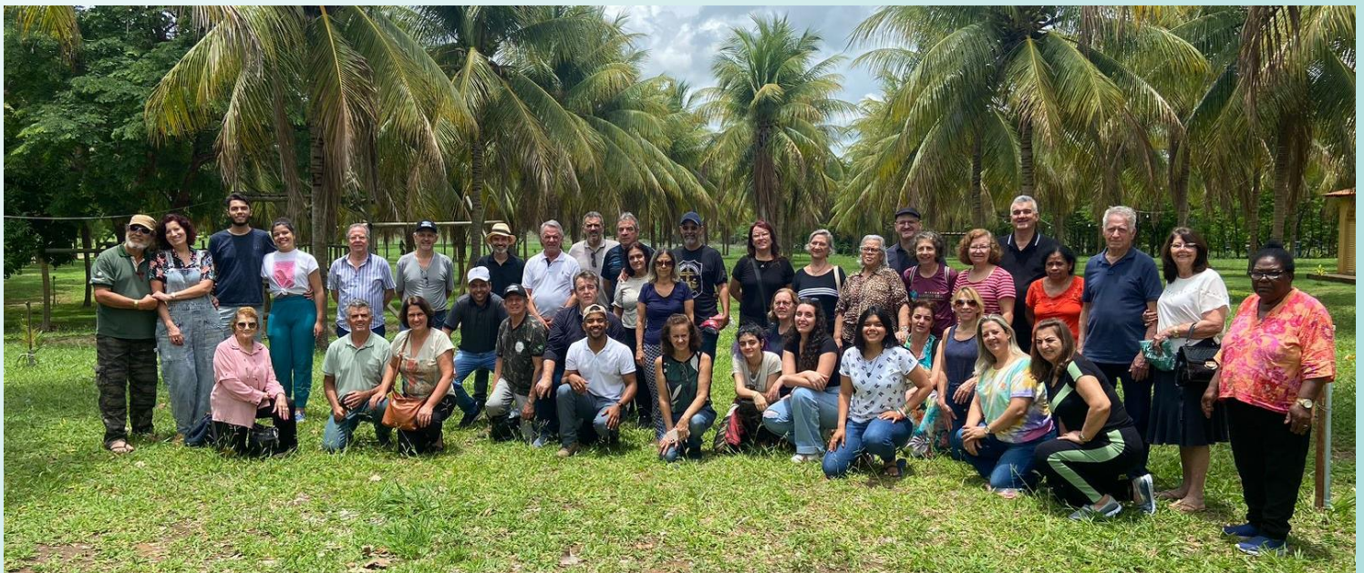
Participantes da Viagem - Acampamento Palavra da Vida

Fomos primeiro até ao Acampamento da Palavra da Vida em Itaobim - MG. Após um delicioso e farto café da manhã, nos dirigimos a cidade de Almenara, já na quinta-feira, dia 17/11. Na parte da tarde fomos até a Congregação Laranjeiras, num local distante da cidade e muito alto. Essa Congregação está em fase de revitalização. Fomos muito bem recebidos ali na Igreja de Almenara, com o apoio e liderança do Rev. Elinton, onde realizamos abençoado culto na sexta-feira, dia 18/11 à noite. Em cada local entregamos doações em roupas, calçados, pó de café Emerick e ofertas em dinheiro. Nas paradas do ônibus houve evangelização com Cânticos, orações e entrega de folhetos. Foi uma viagem abençoada por Deus e impactante. A Ele nossa gratidão!