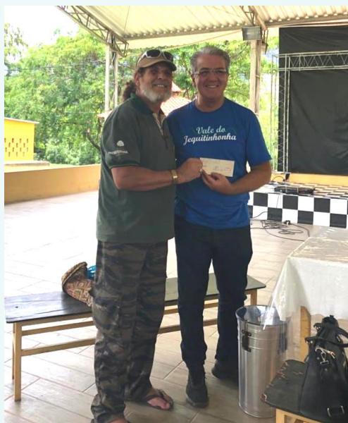
Entrega de Oferta