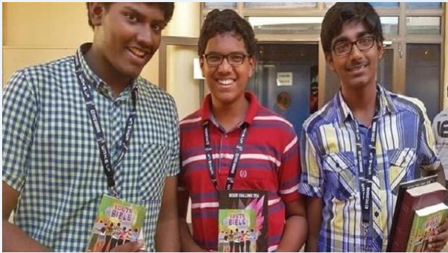
Sociedade Bíblica distribui Bíblias no Catar

Durante a Copa do Mundo no Catar, a Sociedade Bíblica vai distribuir exemplares do Novo Testamento e do Evangelho de João. As Bíblias, em 14 idiomas, serão oferecidas aos turistas de várias nacionalidades que visitarão o país árabe e também aos trabalhadores imigrantes, que estão preparando a estrutura para o maior evento do futebol. “Esta é uma tremenda chance para a Sociedade Bíblica no Golfo alcançar pessoas solitárias, deprimidas e problemáticas – trabalhadores e visitantes – com a consoladora e vivificante palavra de Deus”, destacou o secretário-geral da Sociedade Bíblica no Golfo. A liberdade religiosa é bem restrita nos Emirados Árabes. A Portas Abertas colocou o Catar no número 18 de sua Lista Mundial de países onde é mais difícil ser cristão. O nível de perseguição é considerado “muito alto” com opressão islâmica, opressão de clãs e paranoia ditatorial.