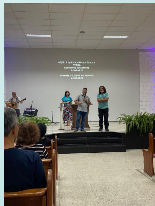
Culto I.P. Almenara