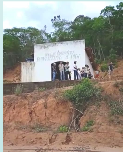
Templo Congr. Laranjeiras / Almenara