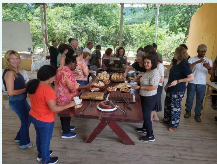
Café da Manhã na PV