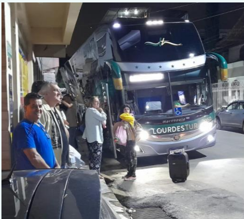
Saída – em frente a quadra

No dia 16 de novembro/22, às 23h30min, uma Caravana da IPM, com 39 passageiros e 02 motoristas, saiu no ônibus semi leito da empresa Lourdes Tour, rumo ao Norte de Minas e Vales do Jequitinhonha e Mucuri.