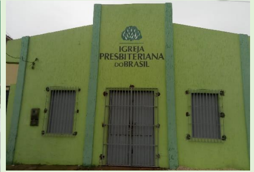
Templo da I. P. Itapecuru Mirim