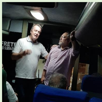
Saída para Aeroporto Presb. César – Proprietário do Hotel