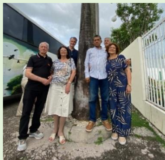
Frente I. P. Chapadinha