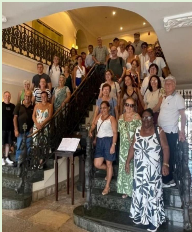
Entrada para visitar o Palácio do Governador do Maranhão