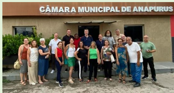
Visita ao Prédio da Câmara M. de Anapurus