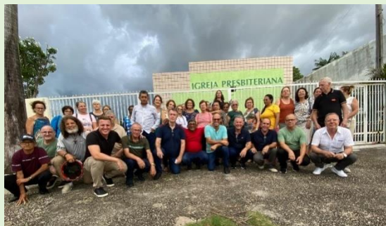
Templo da I. P. Chapadinha