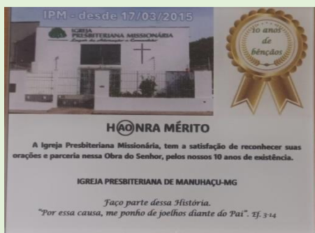
Placa oferecida a todos da Caravana