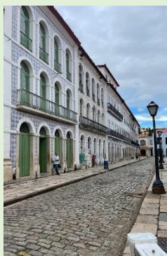
Palácio do Governador do Maranhão/ S. Luís Centro Histórico/ S. Luís