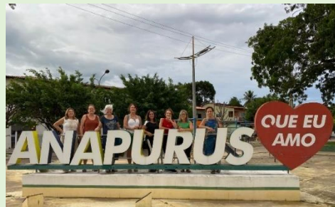
Praça Central de Anapurus