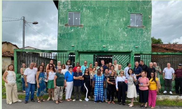
Templo da I. P. Bacabeiras