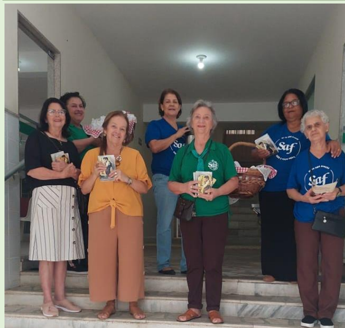
CEF – Cuidando e Evangelizando na Fila 04/10/24 Foram distribuídos 165 Folhetos, 10 Bíblias e 5 Revistas.