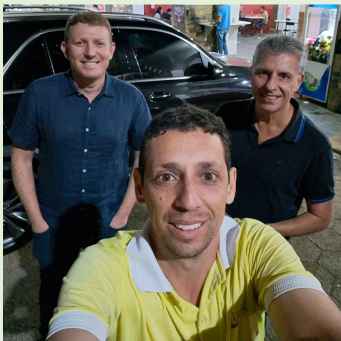
Evangelização em Realeza 30/09/24 Foram distribuídas 274 mini biblias