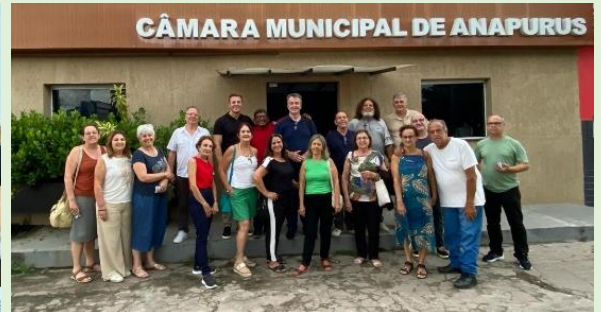
Visita ao Prédio da Câmara M. de Anapurus