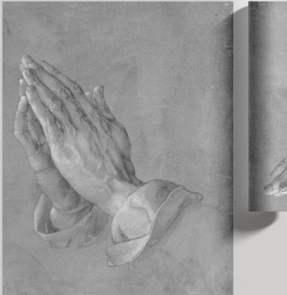
Quadro "Mãos em Oração" Pintura de Albrecht Dürer

Veja história deste quadro na página seguinte