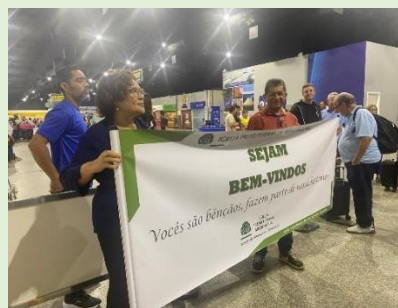
Recepção – Aeroporto S. Luís