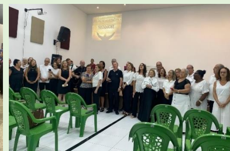
Culto I. P. Missionária