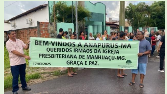
Recepção na I. P. Anapurus