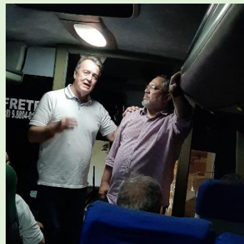
Saída para Aeroporto Presb. César – Proprietário do Hotel