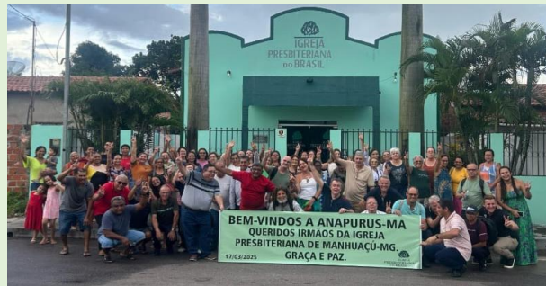
Templo da I. P. Anapurus