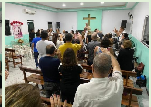
Culto I. P. Anapurus