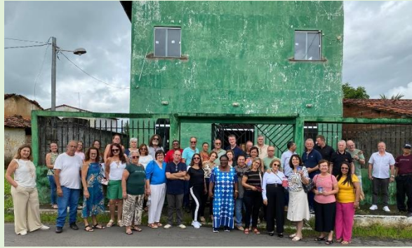
Templo da I. P. Bacabeiras