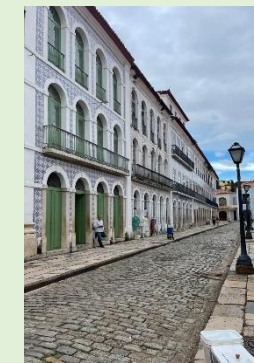
Palácio do Governador do Maranhão/ S. Luís Centro Histórico/ S. Luís