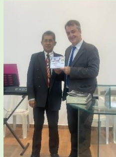
Entrega Placa para I.P. Manhuaçu