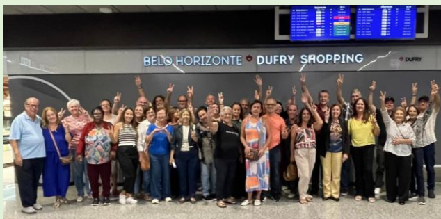
Saída – Aeroporto Confins BH

Foi uma viagem incrível, marcante, desafiadora e repleta orações, louvores, evangelismo e de comunhão entre todos. Só temos uma palavra a dizer: GRATIDÃO.