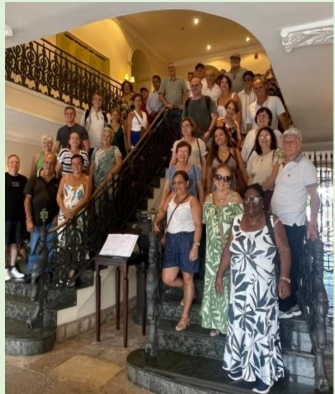
Entrada para visitar o Palácio do Governador do Maranhão