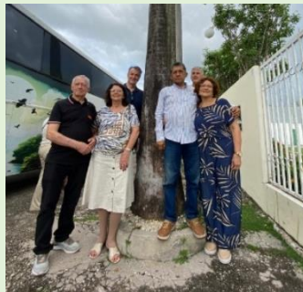
Frente I. P. Chapadinha