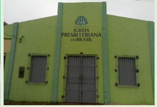
Templo da I. P. Itapecuru Mirim