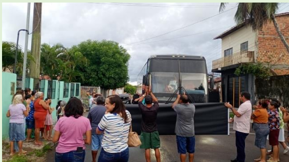
Recepção na I. P. Anapurus