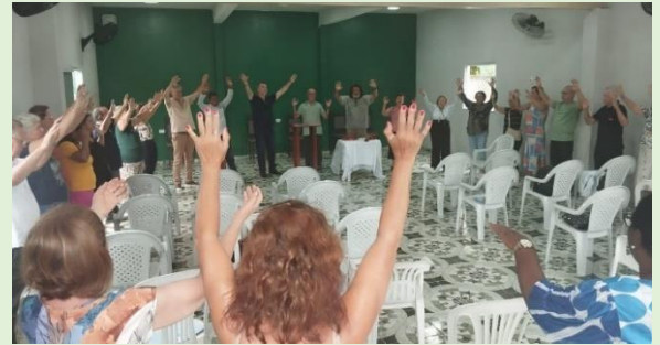
Clamor pela I. P. Bacabeiras