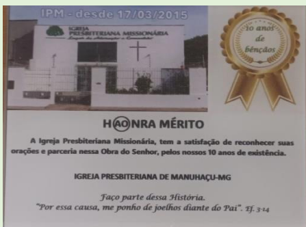
Placa oferecida a todos da Caravana