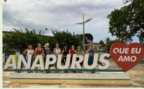
Praça Central de Anapurus