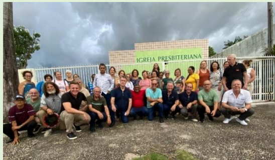
Templo da I. P. Chapadinha