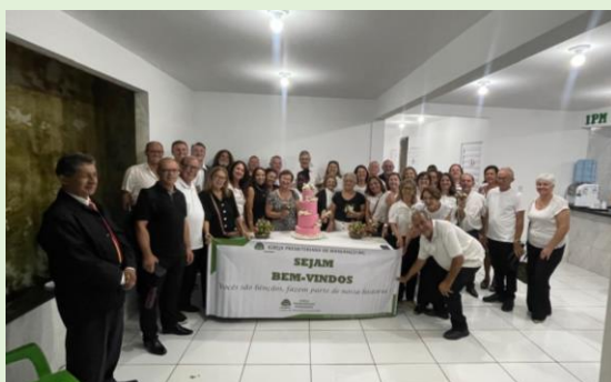
Recepção – Comemoração 10 Anos I. P. Missionária