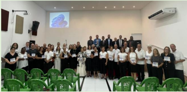
Homenagem – Entrega das Placas