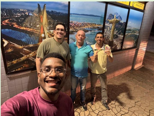
Noite abençoada em Realeza (11/11), com a distribuição de 125 mini bíblias, 2 Bíblias e aproximadamente 280 folhetos.