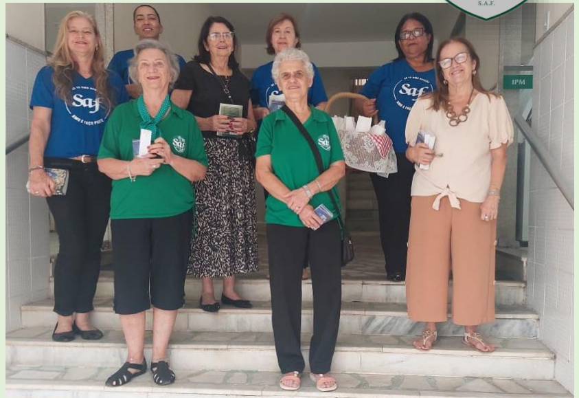
CEF – Cuidando e Evangelizando na Fila (22/11/24) Foram distribuídos 176 folhetos e 10 bíblias