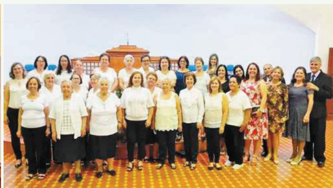
Conjunto Servas de Cristo da SAF - IPAJ