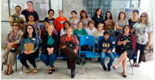
Culto Prefeitura - 12/11/18

Terça-feira, dia 20/11, visitaremos a RENALCLIN. Sairemos da porta da Igreja às 13h45min. Contamos com a presença de todo o grupo.