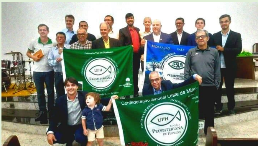
33 anos da Confederação Sinodal de UPHS do SLM Culto na 2ª IPM - 26.10.24